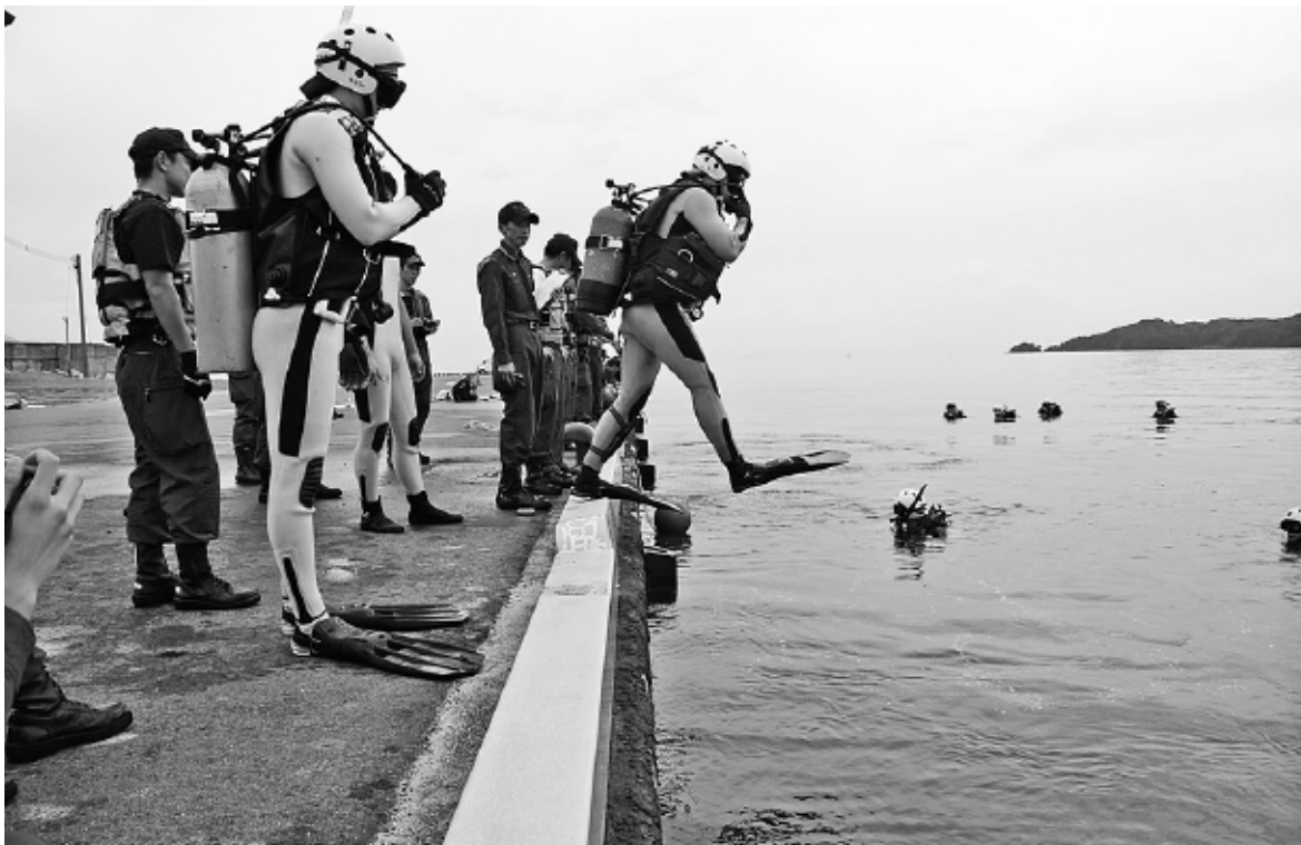
城南4消防本部潜水合同訓練