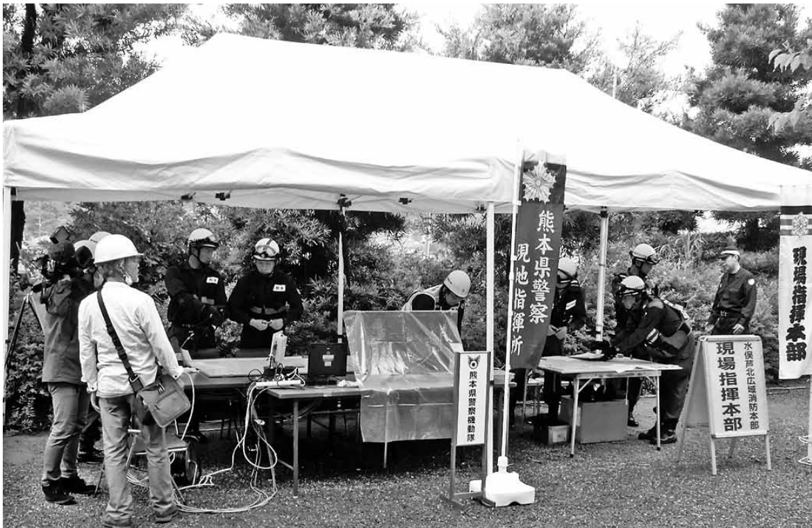
熊本県警との合同訓練（旧水俣高校）