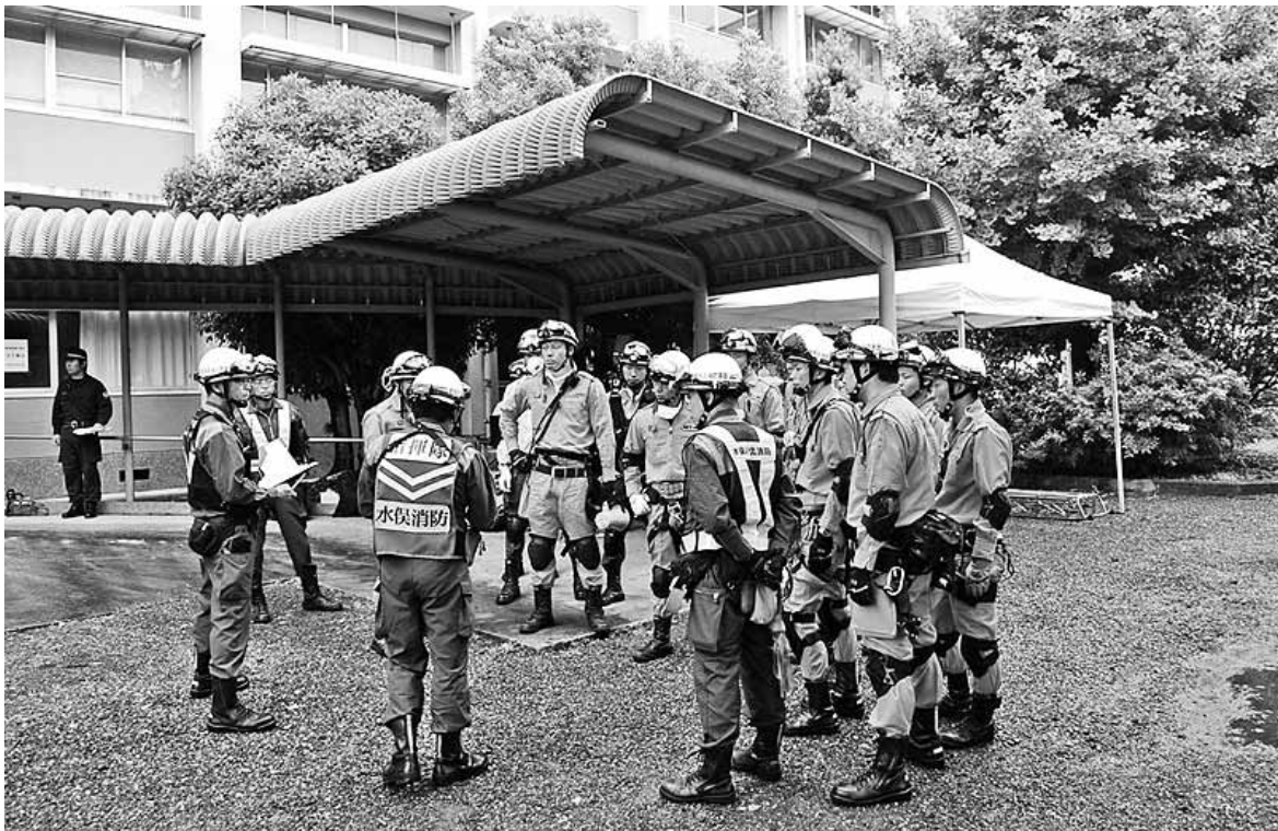
熊本県警との合同訓練（旧水保高校）