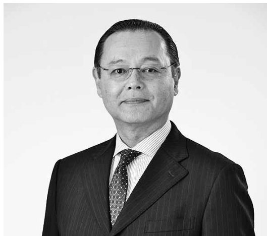
代表理事 水俣市長 高岡 利治