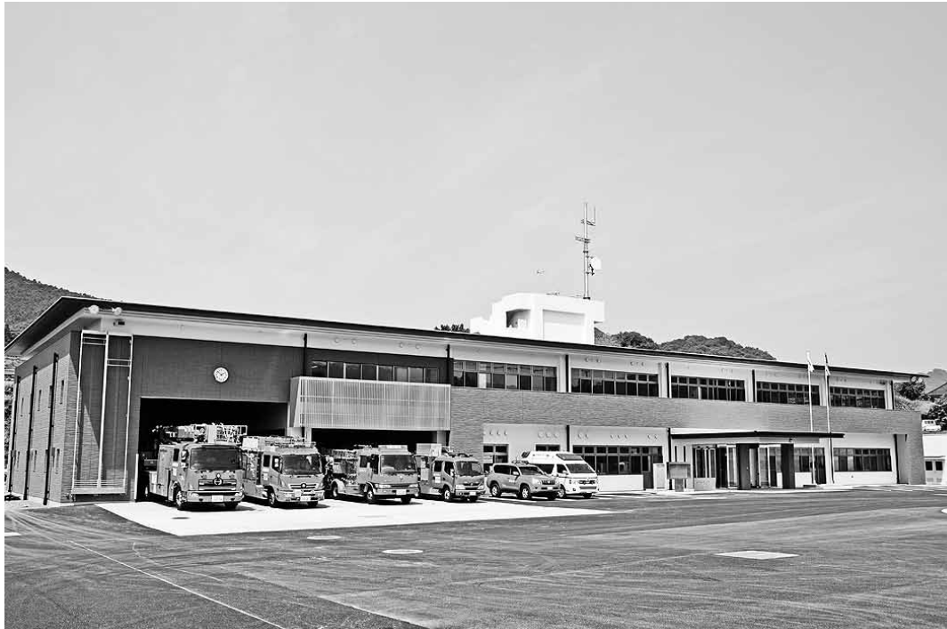
消 防 本 部 (水俣消防署)