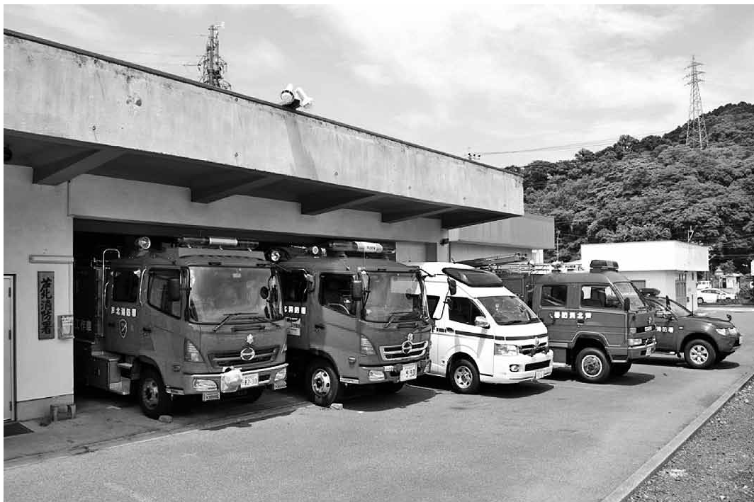
芦 北 消 防 署